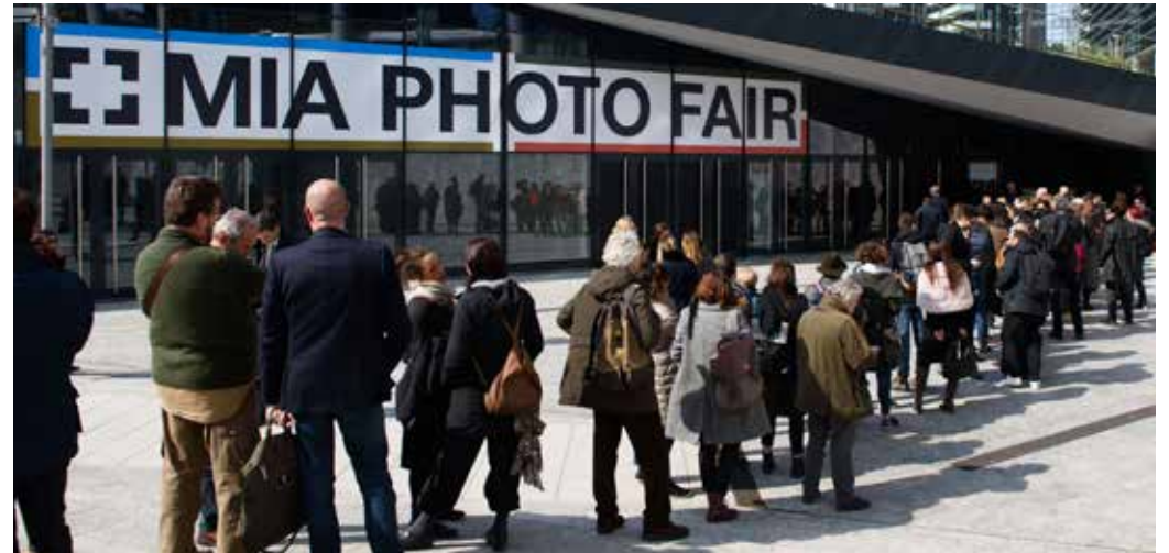
LOCATION - THE MALL PORTA NUOVA