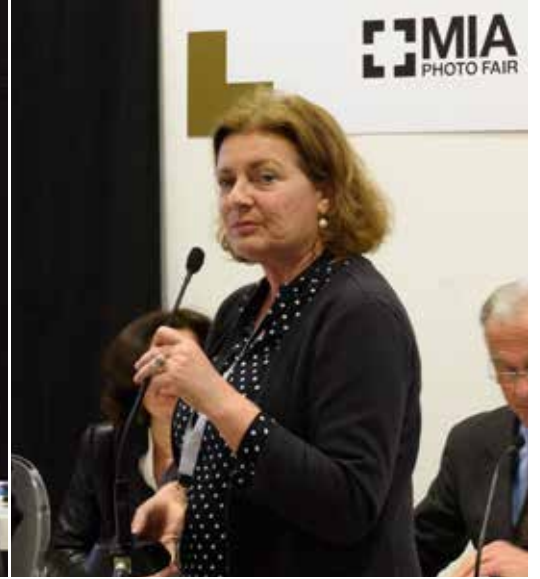
K. Müller Institut d'Estudis Balearics