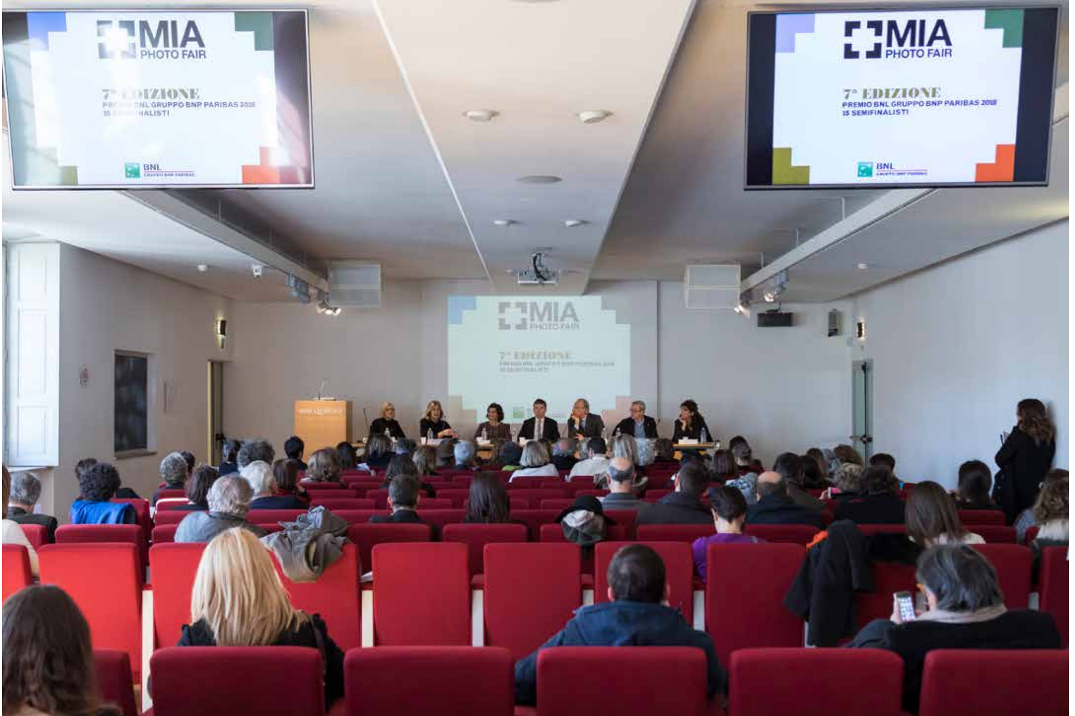
CONFERENZA STAMPA PALAZZO PAZZO REALE - PRESS CONFERENCE PALAZZO REALE