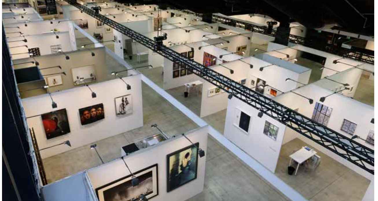
TRA GLI STAND - AMONG THE BOOTHS