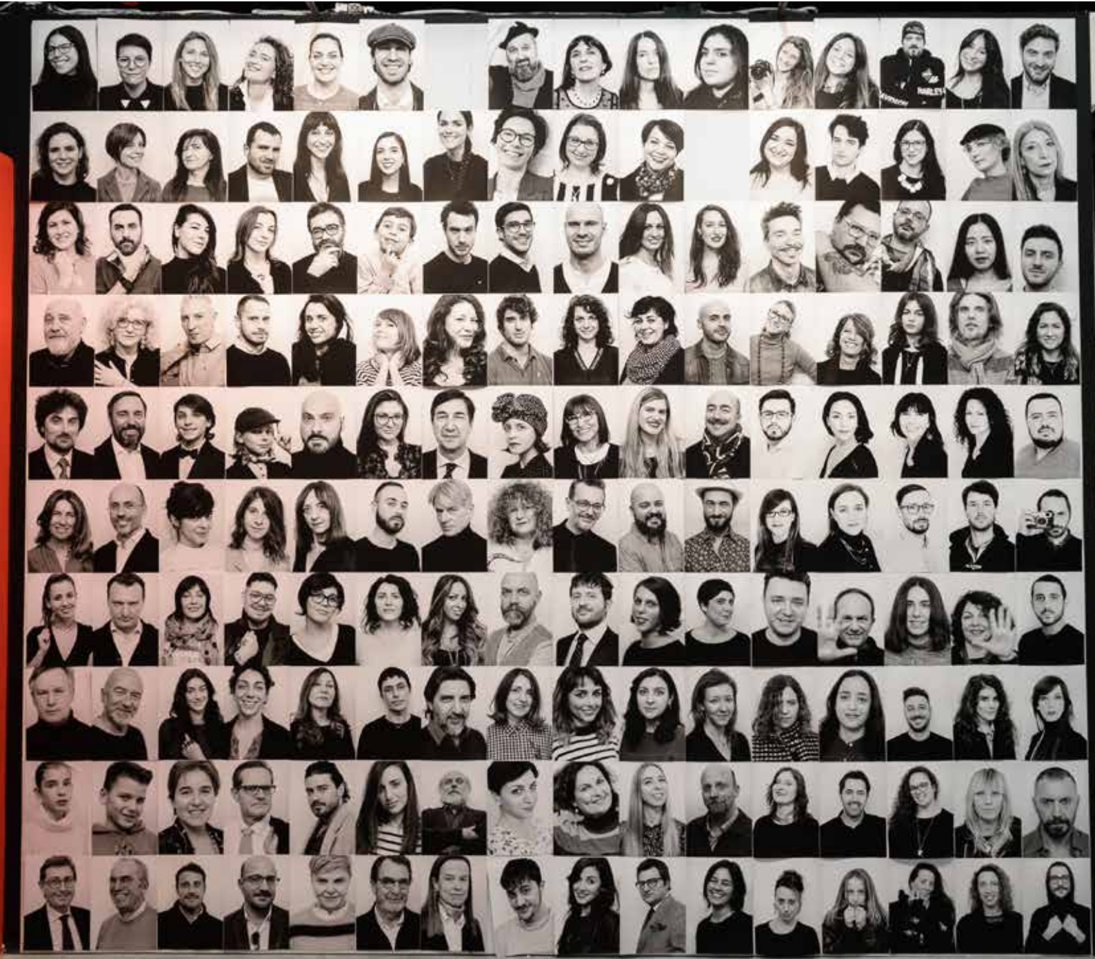
PROGETTO "NON MI RICORDO" DI SETTIMIO BENEDESI PER HP